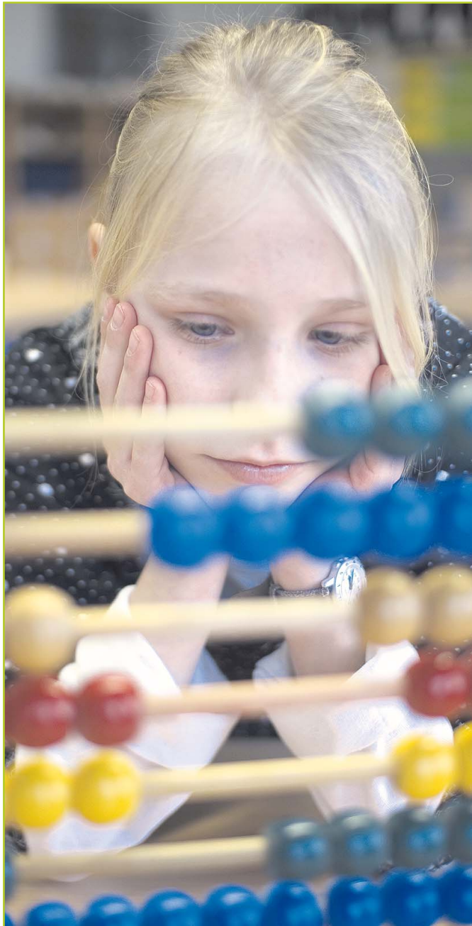
Wenn plus und minus zur Qual werden